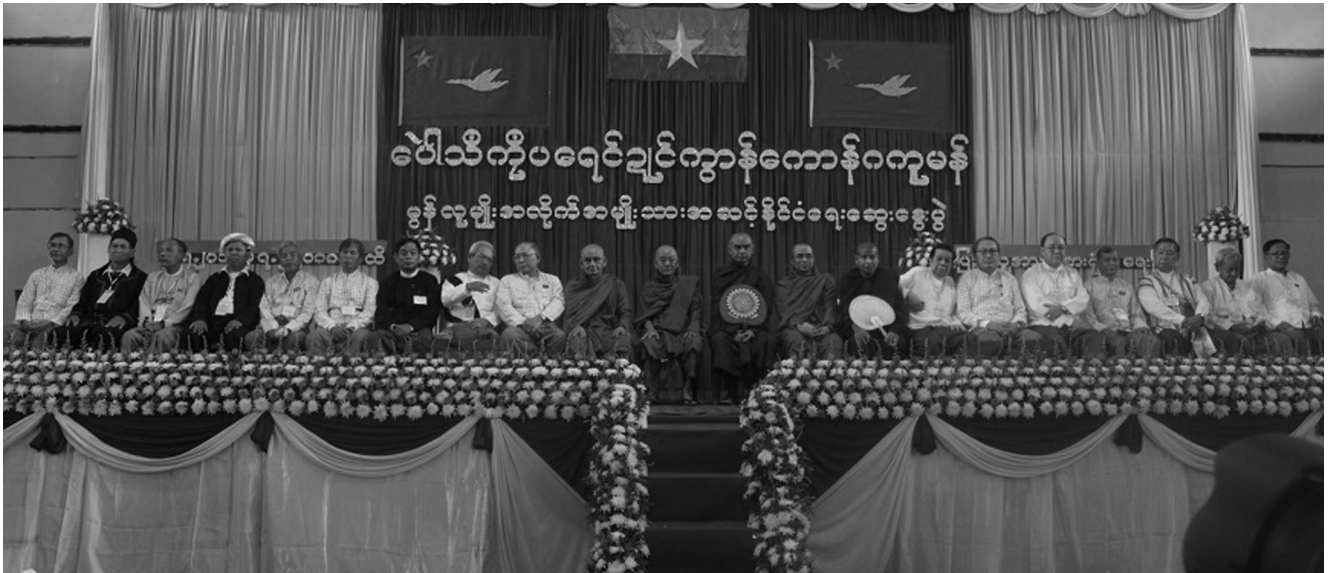
မွန်အမျိုးသားကွန်ဖရင့် (၂၀၁၈) ခုနှစ်