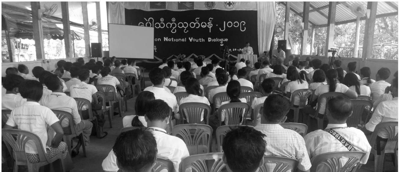
မွန်လူငယ်များ ဆွေးနွေးပွဲ (၂၀၁၉) ခုနှစ်