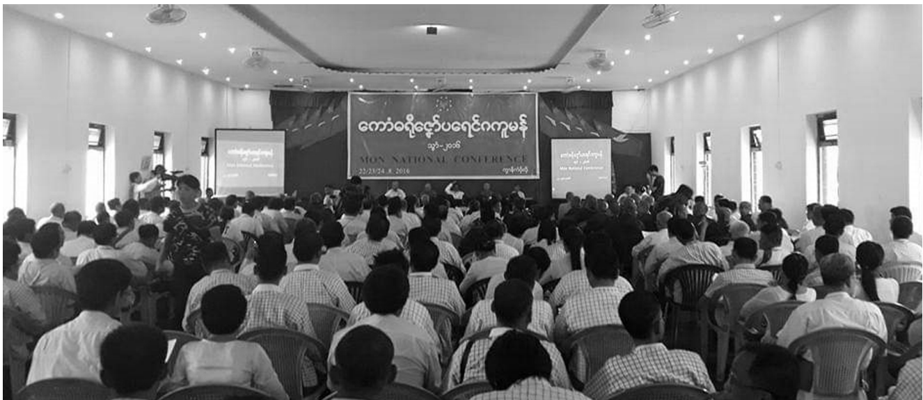
မွန်အမျိုးသားကွန်ဖရင့် (၂၀၁၆) ခုနှစ်