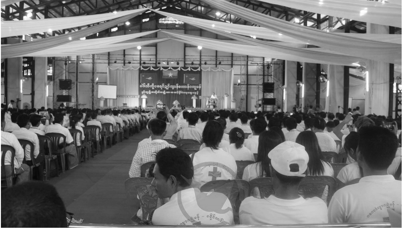
မွန်အမျိုးသားကွန်ဖရင့် (၂၀၁၈) ခုနှစ်